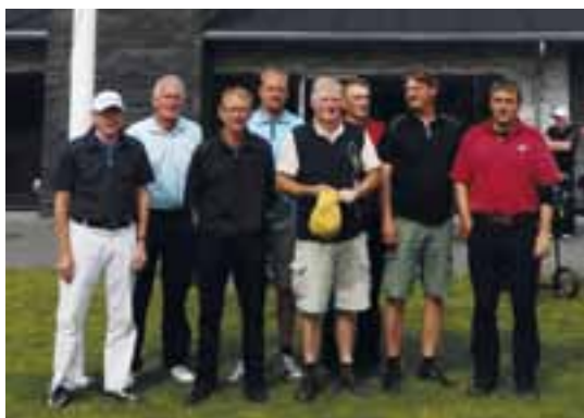
De glade vindere af årets turnering på weekend-turen.