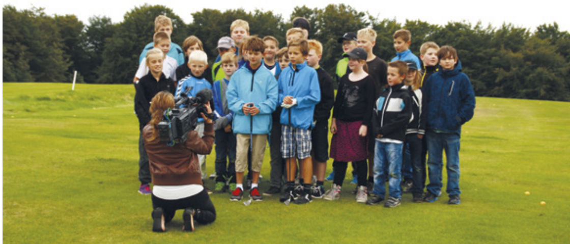
DR's Ramasjang var på besøg i september.

I september havde vi besøg af DR's Ramasjang. De skulle filme til deres live program og havde bl.a. valgt Odder Golfklub. De filmede de 9-12 årige, mens de trænede og derefter udvalgte de to juniorer, som ugen