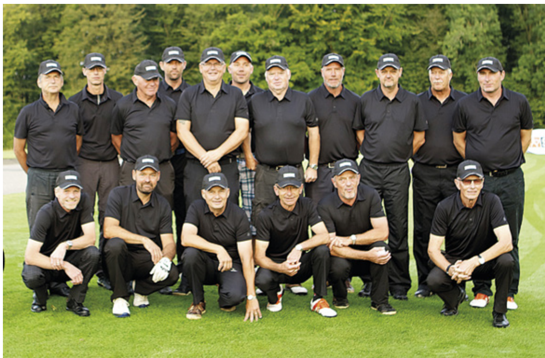
Her er det succesrige hold fra Odder Mens Section. Det vandt Stark Cup på hjemmebane den 1. september

Det var i efteråret Odders tur til at arrangere Stark Cup, der er det nye navn for fir-klub-turneringen mellem Men's Section afdelingerne i Fredericia, Vejle, Horsens og Odder. Den fandt sted den 1. september og Odders greenkeepere havde sat banen meget flot op. De andre klubbers spillere var meget imponerede. ▶