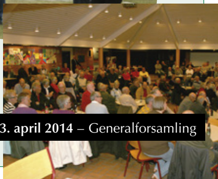
13. april 2014 – Generalforsamling