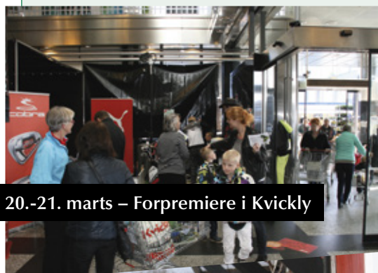
20.-21. marts – Forpremiere i Kvikly

Baneservice bliver generelt modtaget positivt ude på banen. Deres tilstedeværelse er med til sammen med medlemmer og gæster at passe på vores dejlige golfbane.