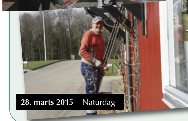
28. marts 2015 – Naturdag