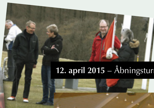
12. april 2015 – Åbningsturnering