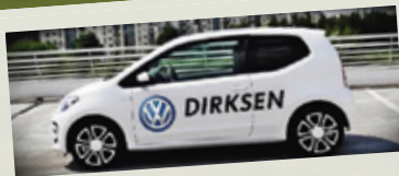
Bilen er vist med ekstra udstyr