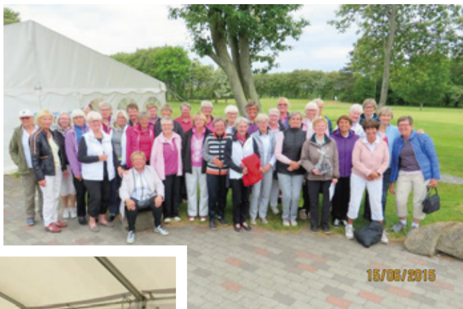
Her er de fleste piger med.

Golfeksperten, Ideer og blomster, Hairshop, SUGI, Center Mode, Mikkell, Kjeldsens boghandel, Jysk, Kop og Kande, Sport 24, Skousen, Sportigan, Anytime, Matas, Anna og Søs og El shop.