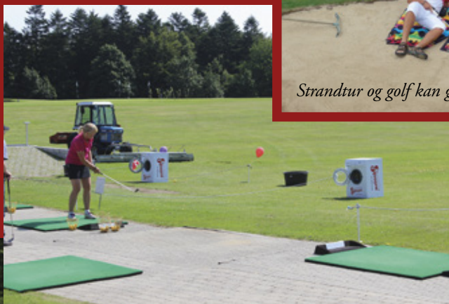
◀ Jubileums boldvasker.