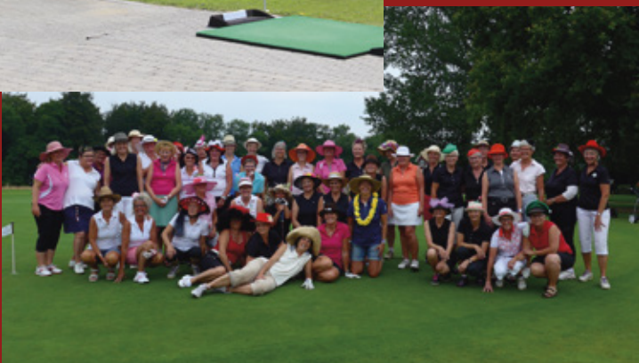
Ladies Section afholdt hatteturnering.