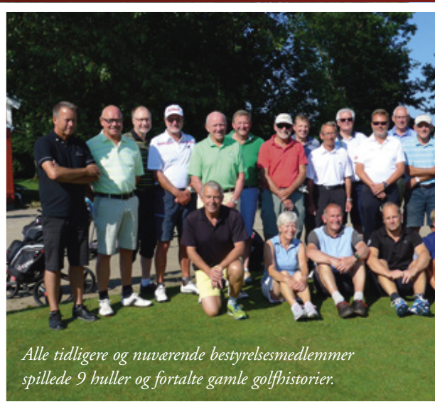
Alle tidligere og nuværende bestyrelsesmedlemmer spillede 9 huller og fortalte gamle golfhistorier.