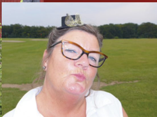
Fra Ladies Sections hatteturnering.