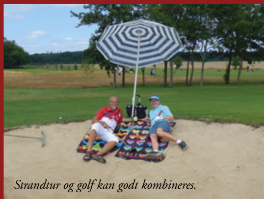
Strandtur og golf kan godt kombineres.