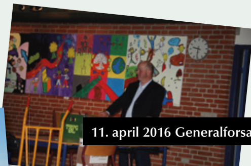
11. april 2016 Generalforsamling