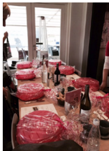
Der var en gaveregn til alle.