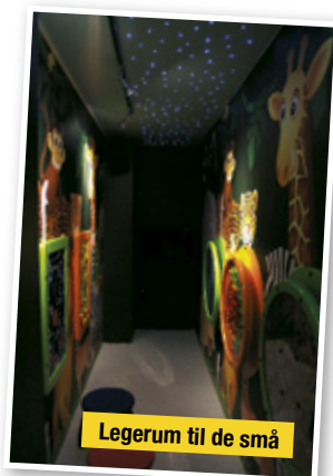
Legerum til de små