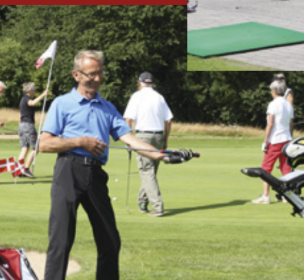
Formanden gav et nummer på luftguitar.