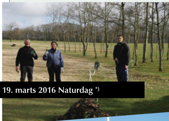
19. marts 2016 Naturdag *)