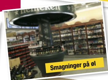
Smagninger på øl