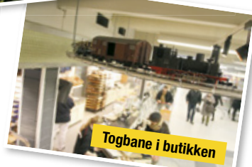
Togbane i butikken