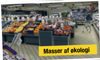
Masser af økologi