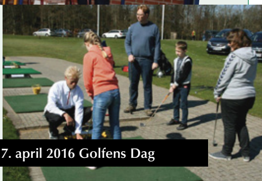
17. april 2016 Golfens Dag

*) Afhængig af vejsituationen kan datoerne blive flyttet.