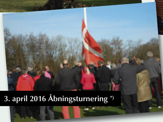
3. april 2016 Åbningsturnering *)