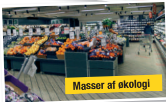
Masser af økologi