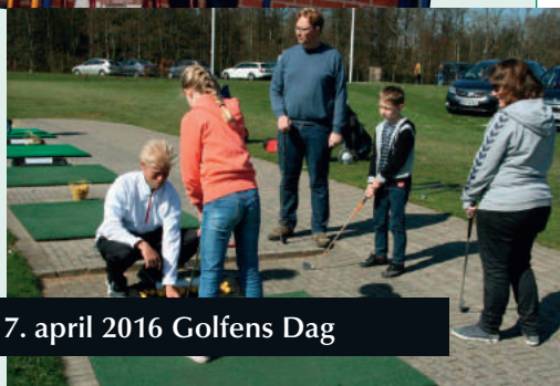
17. april 2016 Golfens Dag

*) Afhængig af vejr-situationen kan datoerne blive flyttet.