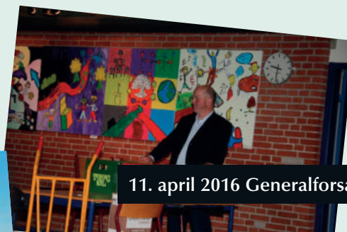
11. april 2016 Generalforsamling