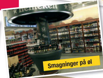
Smagninger på øl