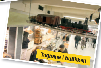
Togbane i butikken