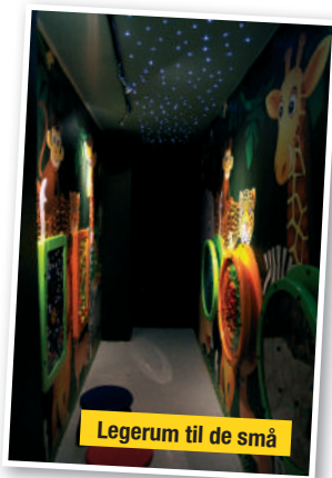
Legerum til de små