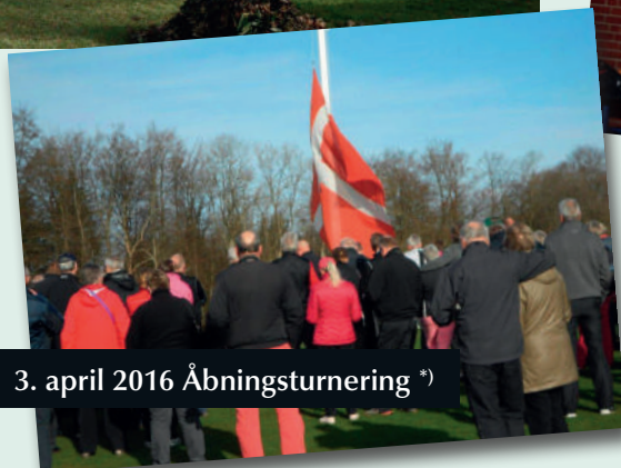
3. april 2016 Åbningsturnering *)