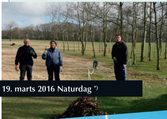
19. marts 2016 Naturdag *)