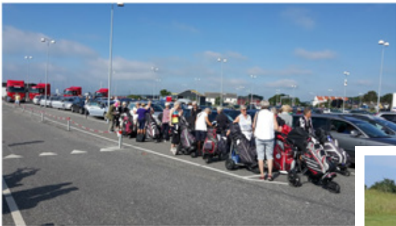
Samsøturen den 19. juni

Vi har i år haft en del ventetid ved hullerne. Det har ofte skyldtes, at der har været pres på banen, og at greenkeeperne selvfølgelig også skulle passe deres arbejde. Dette har vi nu fået talt igennem med greenkeeperne.