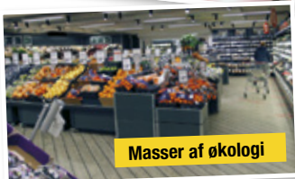
Masser af økologi