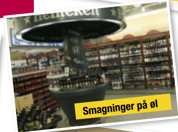
Smagninger på øl