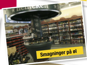
Smagninger på øl