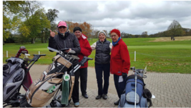
9-huls-pigerne efter spil den 29. oktober.