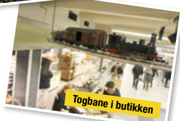
Togbane i butikken