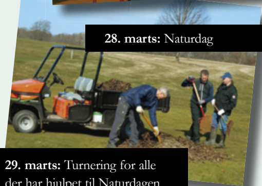
28. marts: Naturdag