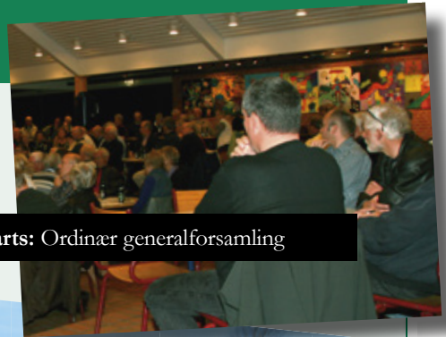
23. marts: Ordinær generalforsamling