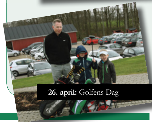
26. april: Golfens Dag