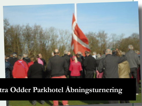
5. april: Montra Odder Parkhotel Åbningsturering