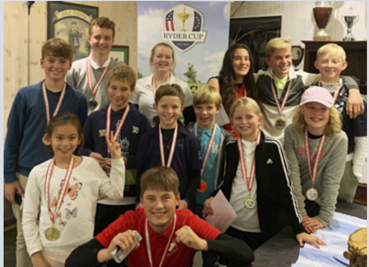
Ryder Cup holdet, USA.

Vi har haft fire turneringshold i hhv. U16A, U16B, U16D og U25C, som alle fik spillet gode kampe og vandt en masse erfaring til kommende sæsoner. Ni spillere var med i JDT distrikts-touren, og fik spillet nogle flotte runder på fremmede baner.