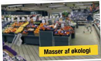
Masser af økologi