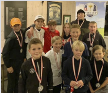
Ryder Cup holdet, Europa.

I løbet af vinteren vil vi så småt gå i gang med at planlægge næste sæsons program, og hvis du har gode ideer, eller gerne vil hjælpe til med afviklingen af et eller flere af vores arrangementer, må du endelig maile juniorudvalget eller give lyd på vores facebook gruppe: Odder Junior Golf.