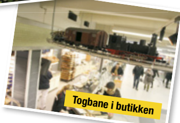
Togbane i butikken