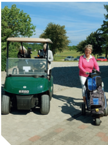
Samsøturen den 14. juni.