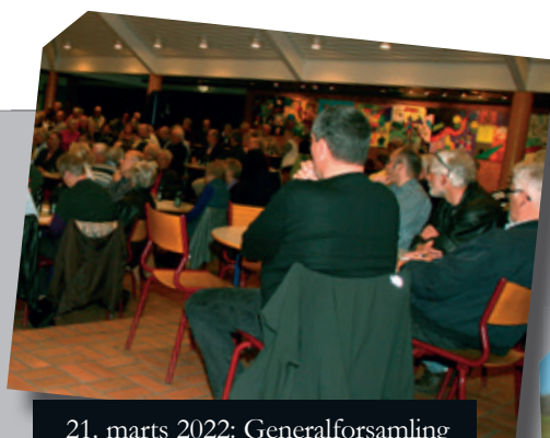
21. marts 2022: Generalforsamling