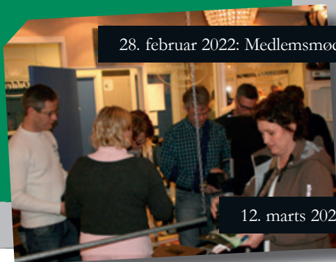
28. februar 2022: Medlemsmøde