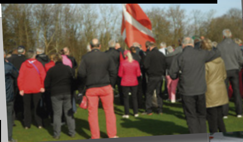
26. marts 2022: Naturdag