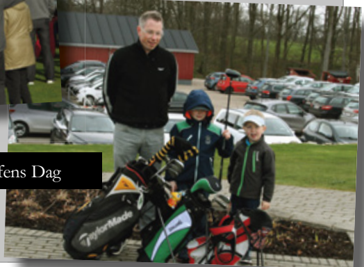
24. april 2022: Golfens Dag