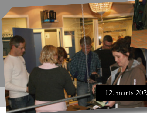
12. marts 2022: Informationsmøde nye golfere