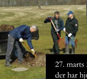
27. marts 2022: Turnering for alle der har hjulpet til på Naturdagen.