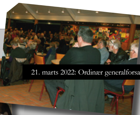
21. marts 2022: Ordinær generalforsamling