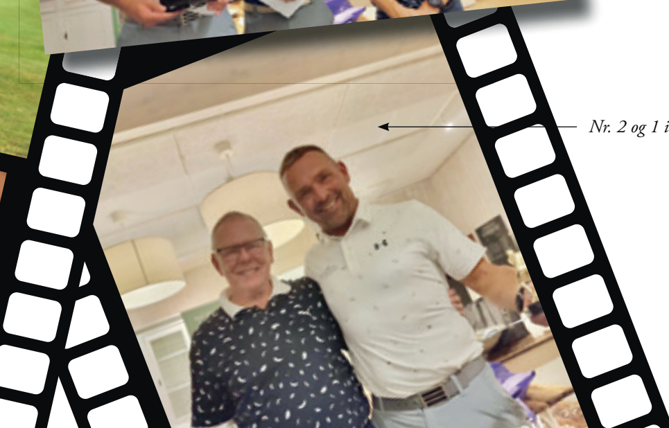
Nr. 2 og 1 i Single hulspil.