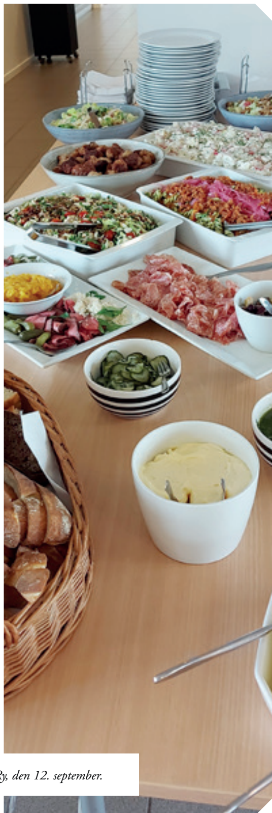
Udflugten til Silkeborg/Ry, den 12. september.