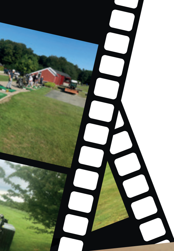
Nr. 1, 2 og 3 i Årsturneringen.