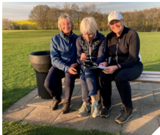
Regnskabet gøres op.