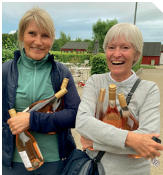
God tirsdag på golfbanen.

Åbningsturnering i 2023 er tirsdag den 11. april kl. 16.30. Den dag er alle interesserede piger velkomne til at spille med – også uden forudgående indmeldelse. Så kan du få et lille indblik i, hvad Ladies Section Odder er. Vi spiller 9 huller Texas Scramble, spiser sammen, hygger, præsenterer sæsonens program.