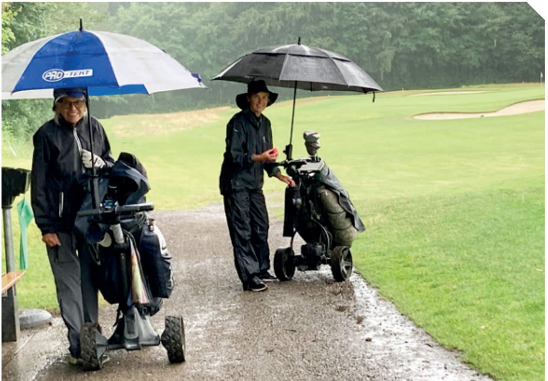
Det var kun en byge.