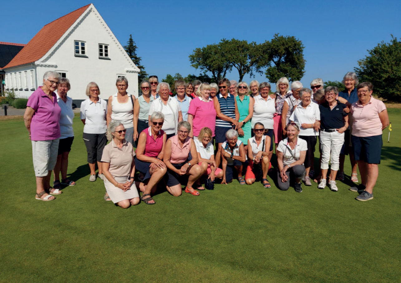
Gruppebillede fra Samsø.

Vi mangler stadig nye ansigter i udvalget. Vi håber på, nogle melder sig og tager en tørn.