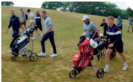
Hjemmekampen d. 18. juni 2023 mod Gyttegaard.