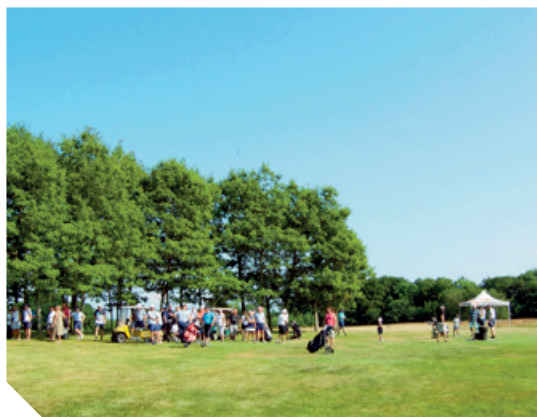
Tilskuere til hjemmekampen mod Gyttegaard d. 18. juni 2023.