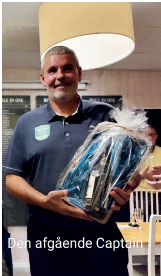
Den afgående Captain

vi glæder os til at give Vejle, Fredericia og Gyttegård kamp til stregen.