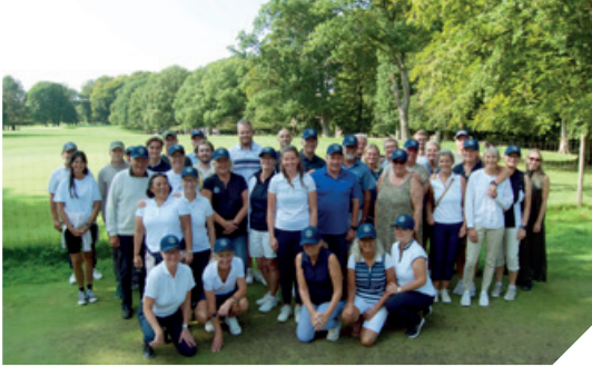
Tilskuere til finalespillet i Københavns Golfklub (fra Odder selvfølgelig).

Og hvilket resultat – wow! Jeg skal ikke her nævne det hele igen, for alle resultaterne for alle vores hold er kendte og det har været et formidabelt år – tak til alle for jeres indsats.