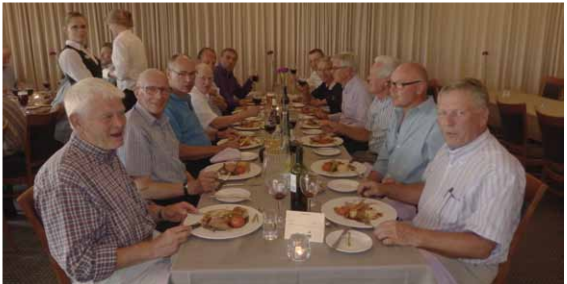
Igen i år var det et godt miks af socialt samvær og golf for de 22 spillere.

Bestyrelsen er i fuld gang med forberedelserne til arrangementet den 1. september, hvor man har skabt rammerne for en mindeværdig dag.